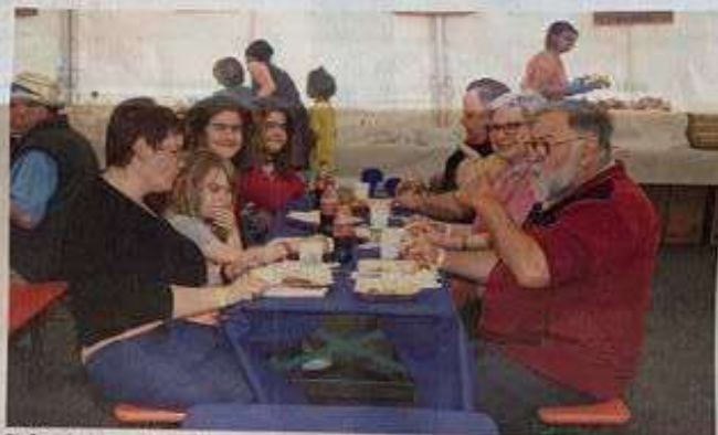
Die Besucherinnen und Besucher genossen beim Brunch die vielen Kostlichkeiten.

Wir feiern aber auch das Gelingen der Behandlungen und die Verbesserung der Behandlungsmethoden.» Er fügte hinzu: «Ich danke auch im Namen aller Patientinnen und Patienten, die dank der Krebs-