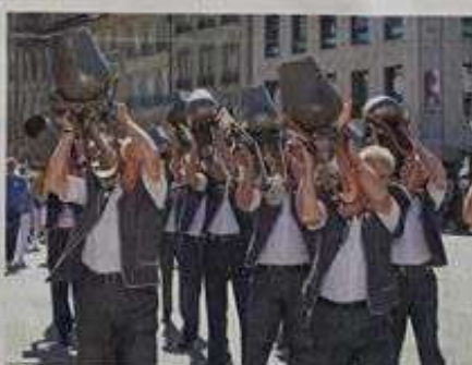
Die Treichler aus La Roche gaben ihr Brauchtum zum Besten.