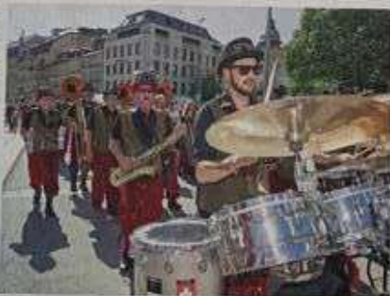
Eine Guggenmusik war für die schrillen Töne besorgt.