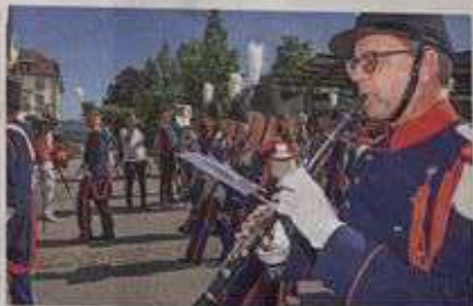
Am Umzug durch die Stadt spielte auch die Landwehr auf.

Den Besucherinnen und Besuchern wurde ein reichhaltiges Musik- und Unterhaltungsprogramm geboten. Kurz vor Mitternacht trat Gion's Fears auf, der die Schweiz am Eurovision Song Contest 2021 vertreten hatte. Der Gewinn aus dem Verkauf der Getränke und Speisen ging an die Krebsliga.