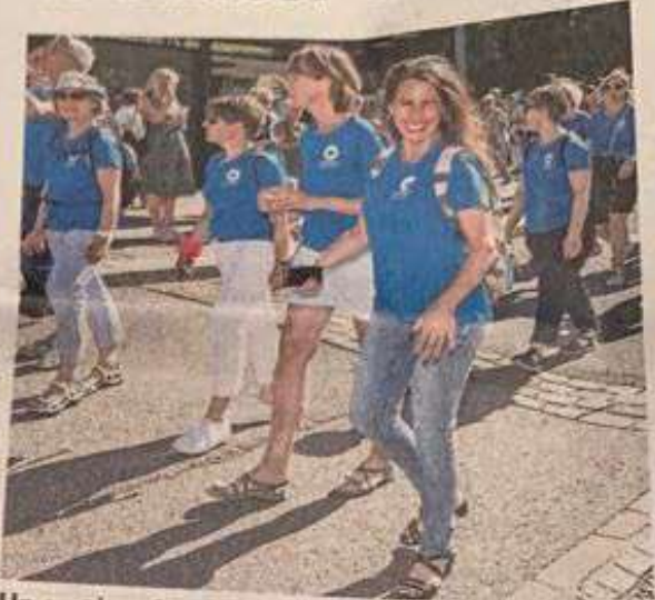
Un cortège était au programme. Laurent Crottet

ANNIVERSAIRE Pour marquer ses 60 ans, la Ligue fribourgeoise contre le cancer s'est offert un bain de foule samed- di. Plusieurs institutions se sont mobili- sées pour marquer ce cap. Elles ont défilé dans un grand cortège à Fribourg. » 9